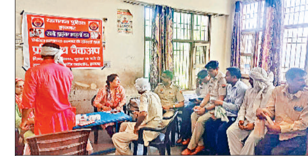
झज्जर। शिविर के दौरान उपस्थित चालक, पुलिसकर्मी एवं चिकित्सकीय टीम।