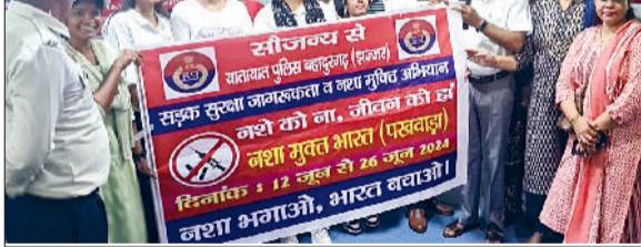
बहादुरगढ़। नशे से दूर रहने का आह्वान करती यातायात पुलिस व स्वयंसेविकाएं।