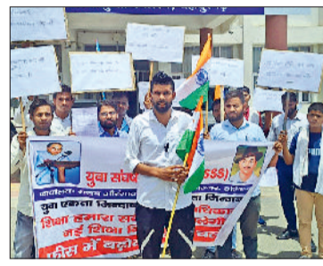
बहादुरगढ़। फीस बढ़ोतरी व नई शिक्षा नीति का विरोध जताते युवा।

महर्षि दयानंद यूनिवर्सिटी द्वारा की गई फीस बढ़ोतरी से युवाओं में रोष है। शुक्रवार को युवा संघर्ष शिक्षा संघ से जुड़े युवाओं ने बहादुरगढ़ में प्रदर्शन किया। इसके बाद एसडीएम ऑफिस में राष्ट्रपति, प्रधानमंत्री, मुख्यमंत्री और एमडीयू के कुलाधिपति के नाम ज्ञापन देकर नई शिक्षा नीति निरस्त करने व फीस बढ़ोतरी पर रोक लगाने की मांग की गई। ज्ञापन में कहा गया है कि युवा