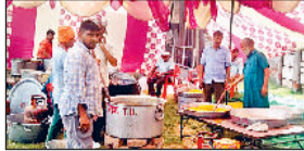
झज्जर। श्रीश्याम बाबा के वार्षिकोत्सव की तैयारियों में जुटे श्रद्धालु।