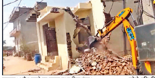
झज्जर। अवैध कब्जे पर चलता हुआ पीला पंजा।