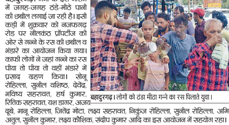
झज्जर। लोगों को ठंडा मीठा गन्ने का रस पिलाते युवा।