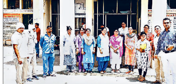
झज्जर। स्थानीय नागरिक अस्पताल के गेट पर एकत्रित एनएचएम कर्मचारी।