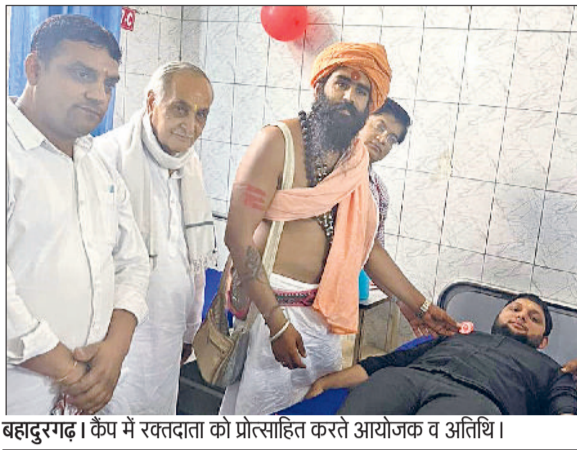
बहादुरगढ़। कैम्प में रक्तदाता को प्रोत्साहित करते आयोजक व अतिथि।