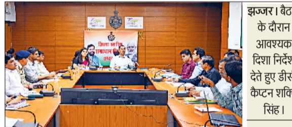
झज्जर। बैठक के दौरान आवश्यक दिशा निर्देश देते हुए डीसी कैप्टन शक्ति सिंह।

आगामी 21 जून को अंतरराष्ट्रीय योग दिवस पर रोडवेज चर्कशाप परिसर में जिला स्तरीय योग कार्यक्रम का प्रोटोकॉल के साथ आयोजन किया जाएगा। इस संबंध में डीसी कैप्टन शक्ति सिंह ने लघु सचिवालय सभागार में अधिकारियों को बैठक ली और आवश्यक दिशा निर्देश दिए। उन्होंने कहा कि संबंधित विभाग अपनी-अपनी विभागीय तैयारी समय रहते पूरा करना सुनिश्चित करें ताकि अंतरराष्ट्रीय योग