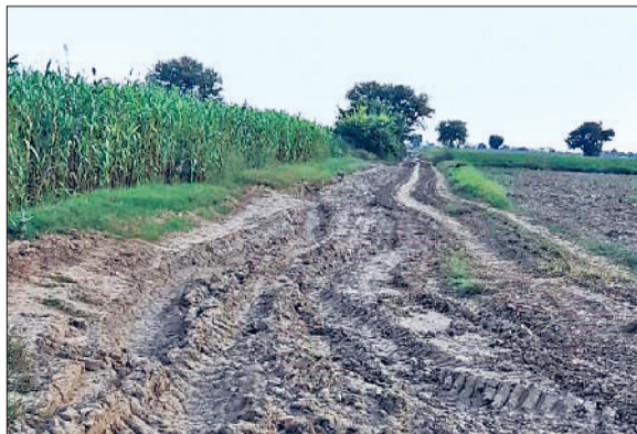
बहादुरगढ़। निर्माण के इंतजार में छारा-कुलताना मार्ग।

प्रधानमंत्री ग्राम सड़क योजना के तहत मंजूरी मिलने के बाद भी छारा-कुलताना मार्ग निर्माण के इंतजार में है। निर्माण शुरू न होने के कारण कच्चे रास्ते से ही किसानों, ग्रामीणों को आना-जाना पड़ रहा है। अधिकारी भी कई बार दौरे कर चुके हैं लेकिन काम चालू नहीं हो पाया है। इस वजह से ग्रामीण परेशान और नाराज हैं। शुक्रवार को गांव के लोगों ने सीएम विडो में शिकायत देकर जल्द से जल्द निर्माण शुरू कराए जाने की मांग की है।